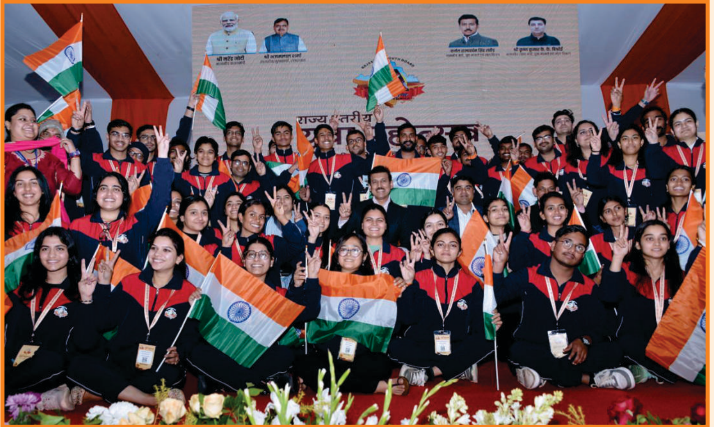
युवा महोत्सव 8 से 12 जनवरी 2025 को जयपुर में आयोजित किया गया।