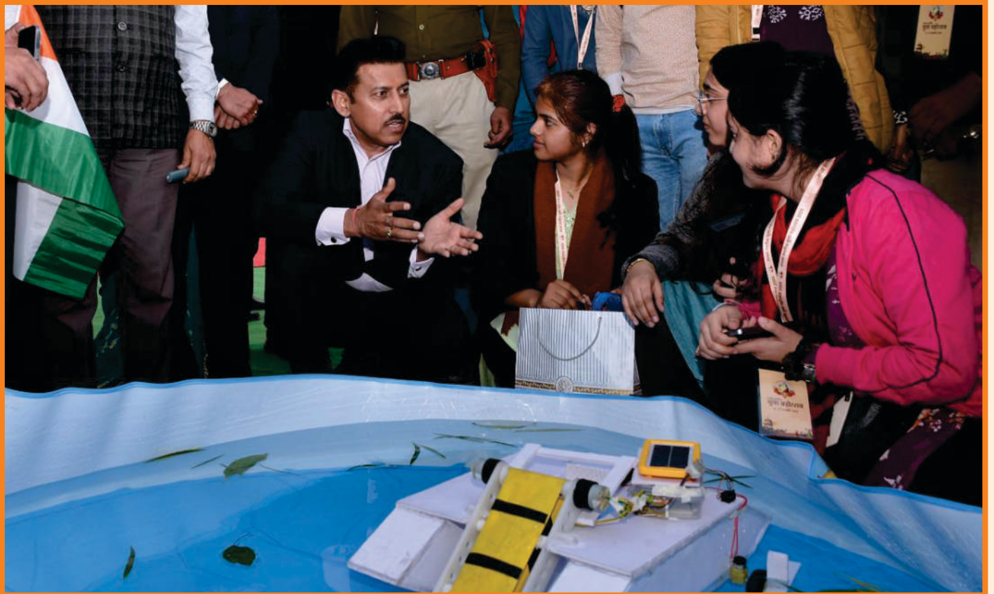
युवाओ से संवाद करते खेल मंत्री कर्नल राज्यवर्धन सिंह राठौड़