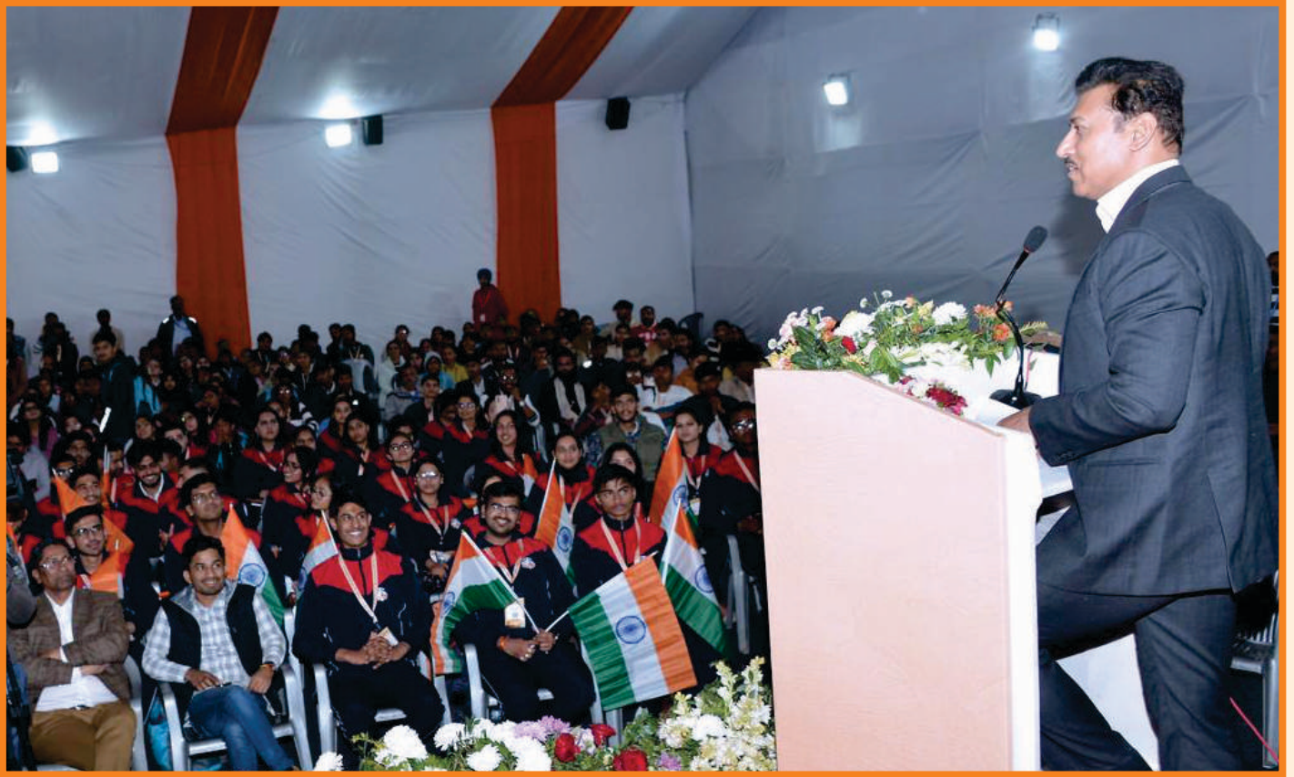
युवा महोत्सव 2025 में युवाओं को संबोधित करते खेल मंत्री कर्नल राज्यवर्धन सिंह राठौड़