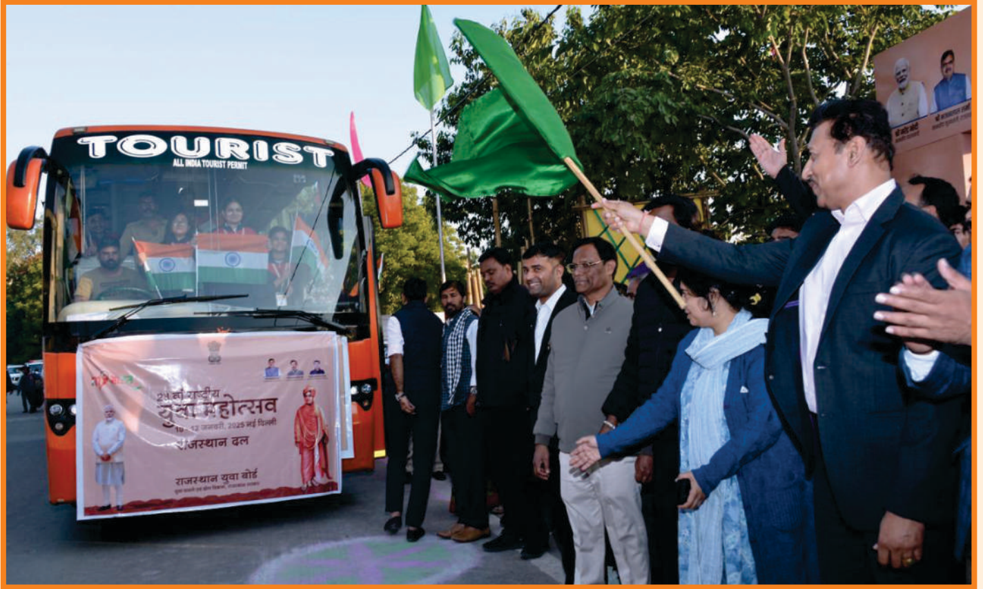
नई दिल्ली में आयोजित युवा सम्मेलन में राजस्थान दल को रवाना करते खेल मंत्री कर्नल राज्यवर्धन सिंह राठौड़